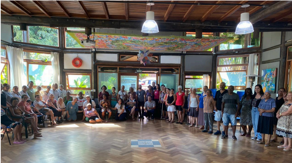
AME na ASJ