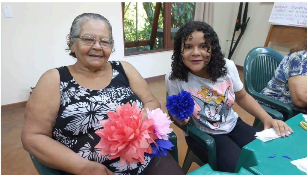
Feitura de flores para o Pastoril